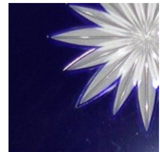
Auspolierter Sternschliff im Detail

Die Glasgröße ist standardmäßig 9cm oder 12cm.