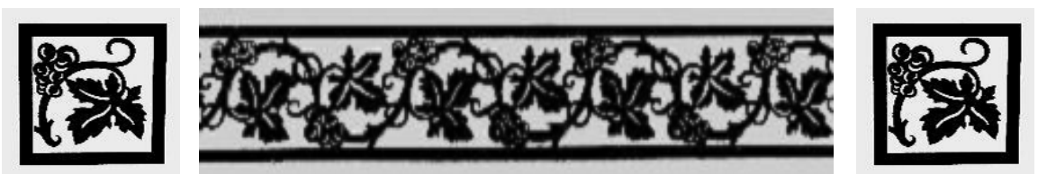
Weinranke - klares Motiv auf mattem Glas