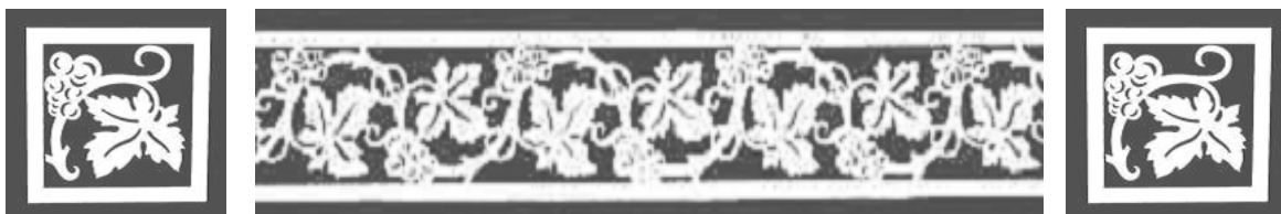
Weinranke - mattes Motiv auf klarem Glas