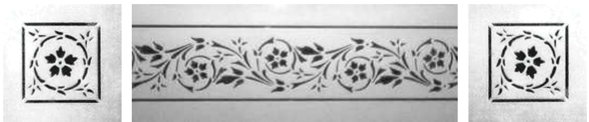
Ranke - klares Motiv auf mattem Glas